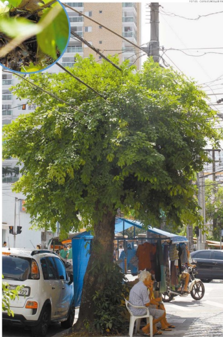
Após quase um ano, a árvore antes ameaçada está recuperada e é morada até de uma rolinha (no alto)