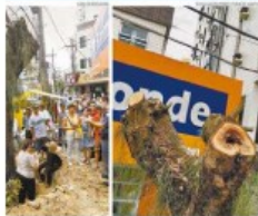
Manifestantes, em frente, mobilizam outras entidades do Ingazeiro-Boqueirão, antiga Prefeitura.

Se você não recebeu o boleto, por favor, envie um e-mail para tribuna@tribuna.com.br ou ligue para o telefone 0800 70 70 70.